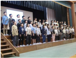
（3年生）総合的な学習の学びの発表 「あおぞら〜府中町大好き わたしたちの町〜」