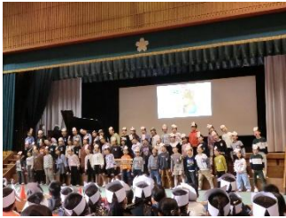
（1年生）児童代表あいさつ・群読・合唱 「ともだちだもん〜こえのうた〜」

11月22日（土）、学習発表会を行いました。子供たちは学習で学んだことをもとに様々な発表内容を考え、見ている人に伝わるように工夫し、心と力を合わせて精一杯発表することができました。保護者の皆様、地域の皆様からいただいた大きな拍手や温かいねぎらいの言葉は、子供たちにとって大きな喜びと達成感につながりました。本当にありがとうございました。