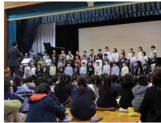
（4年生）総合的な学習の学びの発表 「地球のためにできること」