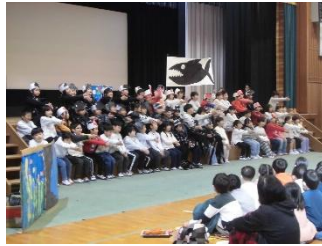
（2年生）音楽物語「スイミー」