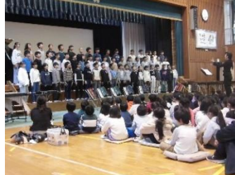
（6年生）よびかけ・合唱・合奏「未来に向かって」