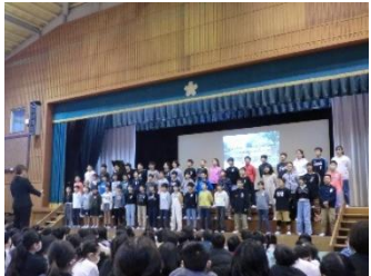
（5年生）総合的な学習の学びの発表・合唱・リコーダー奏 「命を守り抜く」